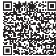
6. White Albedo